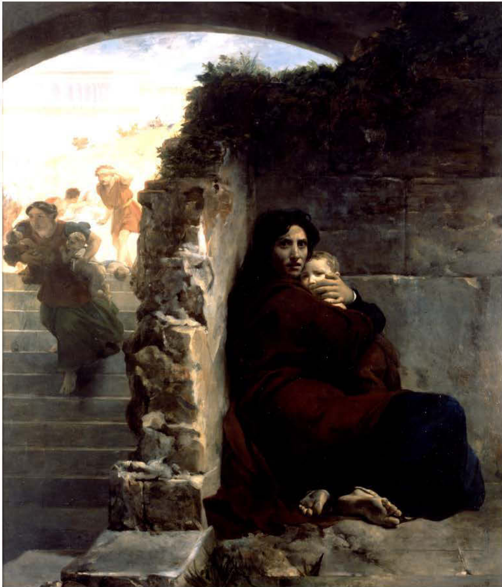
Léon Cogniet Scène du massacre des Innocents 1824 265 x 235 cm

Dossier pédagogique Arts, États et pouvoir