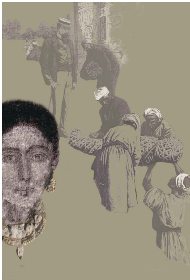
La Dame d'Antinoé III e à IV e siècle, Dépôt du Musée du Louvre en 1923

Le linceul peint de cette momie de femme d'époque romaine est désormais le plus ancien portrait du musée.