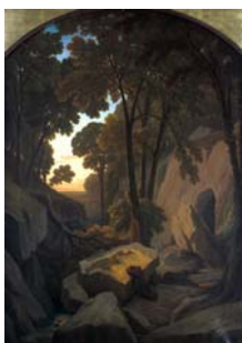
Caruelle d'Aligny Moine en prière 1850

Pour construire une telle scène, pathétique et mélodramatique, l'artiste, comme au théâtre, utilise des procédés connus : on notera ici le savant dosage et la distribution de la lumière jaune sur les personnages, la gamme colorée réduite à des tons sourds et la prégnance des bruns tout autour.