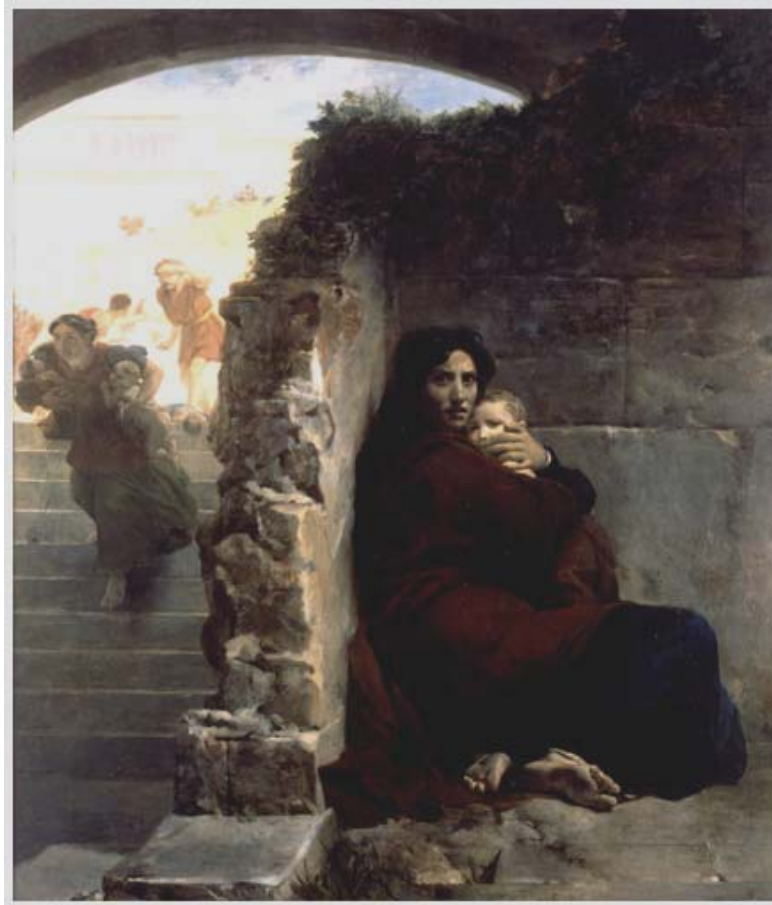
Léon COGNIET, Scène du massacre des Innocents , 1824