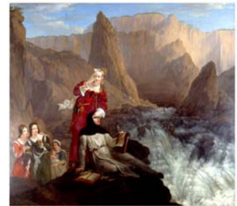
Philippe-Jacques Van Brée Laure et Pétrarque à la fontaine de Vaucluse 1816 (notice page 19)

Baigné d'une lumière presque irréaliste, le paysage aux accents sauvages et fantastiques contraste singulièrement avec des personnages traités à la manière de figurines porcelainées.