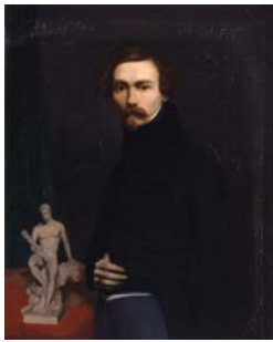
Eugène Amaury-Duval Autoportrait 1832

Auprès du portrait d'Isaure se trouve l'autoportrait de l'artiste, aux accents romantiques par sa tonalité sombre et son regard pénétrant en direction du spectateur.