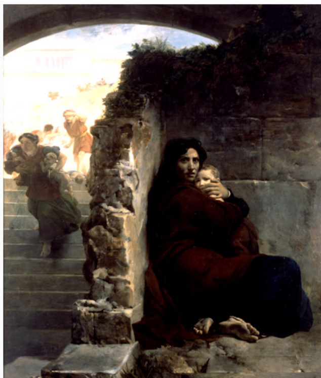
Léon COGNIET (Paris, 1794 - Paris, 1880) Scène du massacre des Innocents 1824

Huile sur toile 265 x 235 cm Acquis en 1988