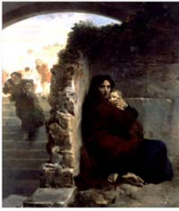
Léon Cogniet Scène du massacre des Innocents 1824 (notice page 21)

Léon Cogniet est bien un peintre de son temps ; il est réputé bon portraitiste, bon paysagiste, bon peintre de genre et s'accommode de la tendance exotique curieuse d'Orient, d'Italie, du Moyen-Age... Le tableau du Massacre des Innocents , exposé au salon de 1824 reçut à l'époque une bonne critique même si Stendhal le « bouda ».