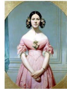
Eugène Amaury-Duval Portrait d'Isaure Chassériau 1838

C'est une peinture qui joue sur l'audace d'un coloris acide (rose et vert) et sur la retenue d'une composition dépouillée où sourd la géométrie (ovale du corps / angle droit des lambris).