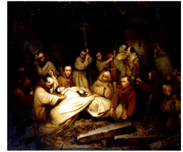
Claudius Jacquand Comminges 1836 (notice page 22)

L'étude comparative des œuvres montre un parti pris beaucoup plus narratif et même pourrait-on dire illustratif. Le tableau n'est compréhensible qu'à la condition d'en connaître le sujet. Celui-ci est tiré de l'œuvre de François de Baculard d'Arnaud les Amours malheureux ou le comte de Comminges , drame en trois actes paru en 1764 à Paris et que l'on peut rattacher au tout premier courant gothique, qui teinte la fin du XVIIIe siècle d'accents préromantiques. C'est à cette époque que naît en Angleterre « le roman noir » notamment Le Moine de Lewis. Le tableau est exposé au salon de 1836 et c'est encore la vogue du courant troubadour.