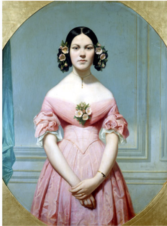
Eugène AMAURY-DUVAL (Montrouge, 1808 - Paris, 1885) Portrait d'Isaure Chassériau 1838

Huile sur toile 117 x 90 cm Don d'Eugène Froment, 1886