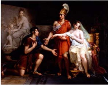
Charles Meynier Alexandre Le Grand cédant Campaspe à Apelle 1822 (notice page 20)

L'époque est charnière mais le néoclassicisme fait encore autorité (composition de figures d'aspect lisse et ombré faisant valoir des qualités de dessin selon la théorie du pur contour chère à Winckelmann et sujets historiques puisés dans l'antiquité gréco-romaine).