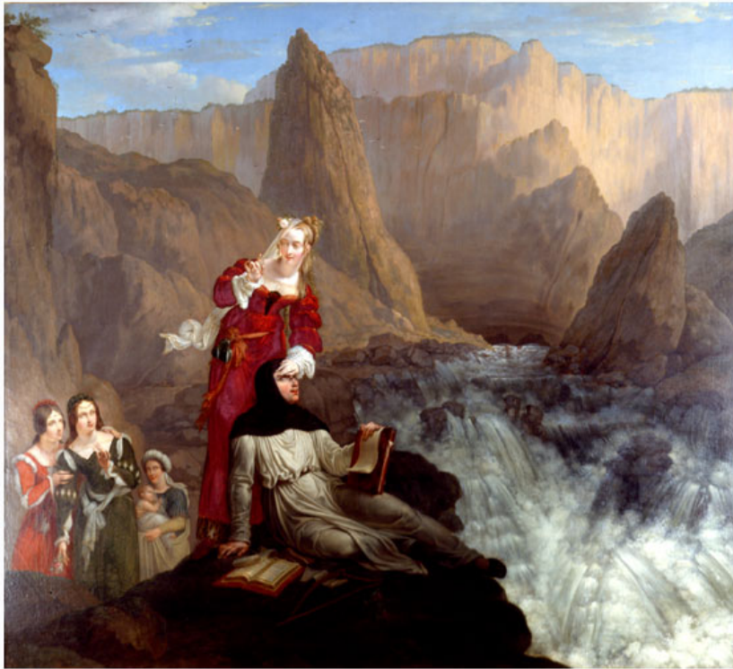
Philippe-Jacques Van BRÉE (Anvers, 1786 - Bruxelles, 1871) Laure et Pétrarque à la Fontaine de Vaucluse 1816

Huile sur toile 146,5 x 162,7 cm Don de M. Ménager, 1927