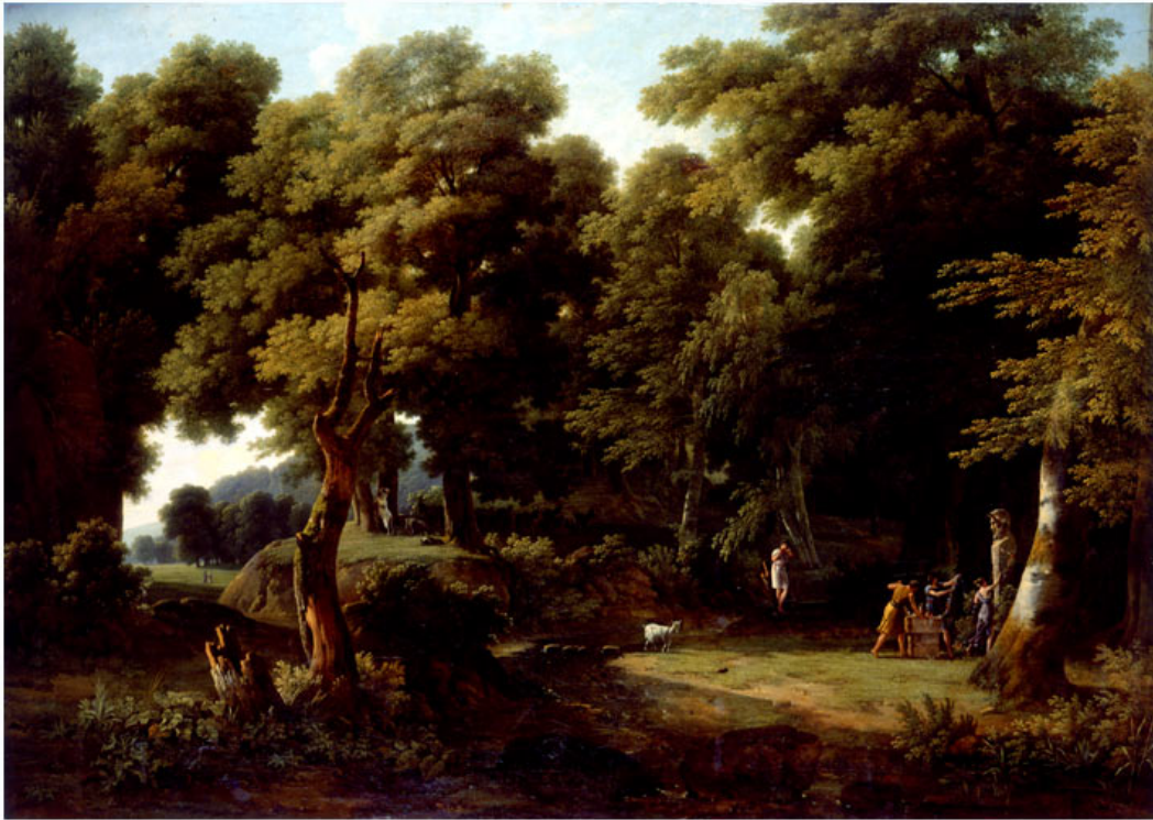
Jean-Victor BERTIN (Paris, 1775 - Paris, 1842) Paysage avec une offrande au dieu Pan 1816

Huile sur toile 113,5 x 162,5 cm Dépôt de l'Etat, 1824