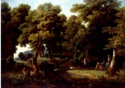
Jean Victor Bertin Paysage avec une offrande au dieu Pan 1816 (notice page 18)

Le grand paysage héroïque tel que le créa Poussin au XVII e siècle, baigné d'une lumière limpide et où s'immergent les héros antiques trouve ici un écho certain du côté des grandes frondaisons et des sereines clairières. Un dieu d'un autre âge (terme) dresse son image de pierre dans un décor champêtre. Chèvres sacrifiées et guirlandes de fleurs sont l'objet d'une offrande à laquelle s'affairent quelques bergers.