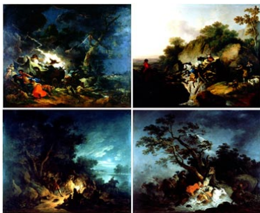
Francesco Casanova Paysans surpris par un orage Rupture d'un pont Attaque de brigands pendant la nuit Voyageurs pris dans un ouragan vers 1770 (notice page 17)

On observe pourtant chez tous les peintres de cette génération néoclassique une « contamination » naturaliste. Les paysages d'Italie réalisés lors du voyage inaugural de début de carrière ont des accents de vérité et cèdent moins qu'auparavant à la construction artificielle. Revenus en France, beaucoup de ces peintres s'inspireront directement de sites familiers, franciliens ou régionaux.