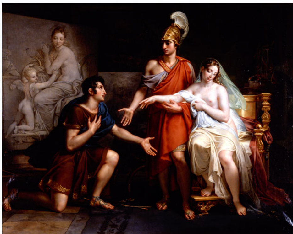
Charles MEYNIER (Paris, 1768 - Paris, 1832) Alexandre le Grand cédant Campaspe à Apelle 1822