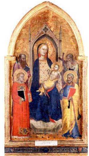
Tableau destiné à la dévotion privée qui met en évidence le rôle déterminant de la Vierge dans l'Église. Au cours du Moyen Âge, le culte marial se développe, notamment à partir du XII ème siècle ; les représentations de la mère du Christ, personnage majeur parmi les intercesseurs, reprennent des codes qui permettent sa réception par les fidèles.