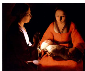
Georges de LA TOUR (1593-1652) Le Nouveau-né Huile sur toile 76 x 91 cm