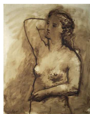
Pablo PICASSO (1881-1973) Nu à mi-corps 1923 Huile sur toile 100 x 80 cm