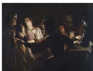
Gerrit VAN HONTHORST (1590-1656) Le Reniement de saint Pierre Huile sur toile 150 x 197 cm