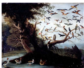
Jan KESSEL (1626-1679) L'Arbre aux oiseaux Huile sur cuivre 17 x 22 cm