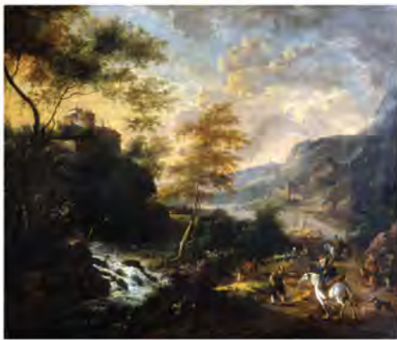
Frederijck Moucheron, Paysage avec chasseurs , 17 e siècle

Voici quelques paysages accrochés aux cimaises du musée, ils t'aideront à compléter les activités de ce découvrir'art.