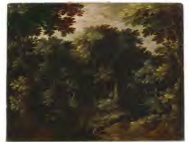
Cercle de Gillis III Van Coninxloo (attribué à) Coin de forêt , 17 e siècle

Le paysage est un tableau représentant l'espace extérieur (un site champêtre, un site urbain, un site maritime...) L'histoire de la peinture de paysage est intimement liée à l'évolution du sentiment de la nature. Le paysage joue un rôle important dans la peinture décorative dès l'époque romaine. Le Moyen Âge l'ignore, si ce n'est sous une forme symbolique (fresques du palais des papes à Avignon). La renaissance du genre ne se produit qu'au XV e s., avec les fonds de paysages des miniatures (frères Limbourg) et des panneaux religieux (Italie, Flandre). Le paysage en tant que tel, pour lui-même apparaît au XVI e s. avec Patinir et Bruegel le Vieux. (définition de l'encyclopédie Larousse)