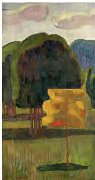
Emile Bernard, L'Arbre jaune, vers 1892

Dessine dans ce rectangle ton paysage à l'aide de tes propres formes d'arbre.