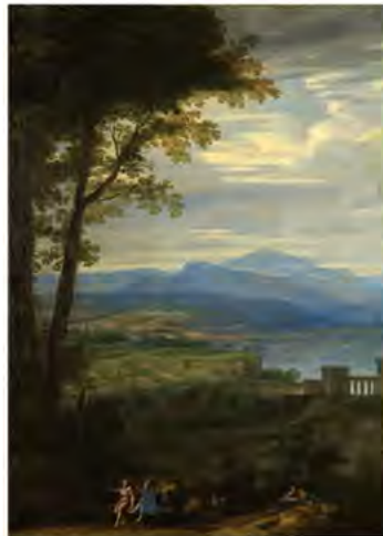
Philippe de Champaigne (?), Paysage avec figures , 17 e siècle