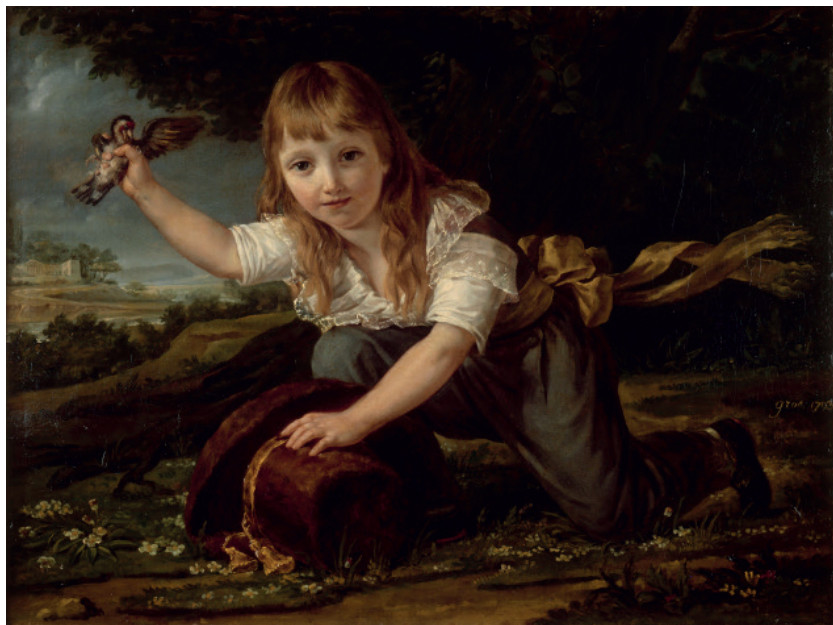
Antoine-Jean Gros, Portrait de Paulin des Hours (1793)

Visiter le musée avec ses élèves se fait de deux façons : soit avec un médiateur du musée soit en visite autonome sous la conduite d'un enseignant. Les réservations sont obligatoires pour les deux formes de visites.