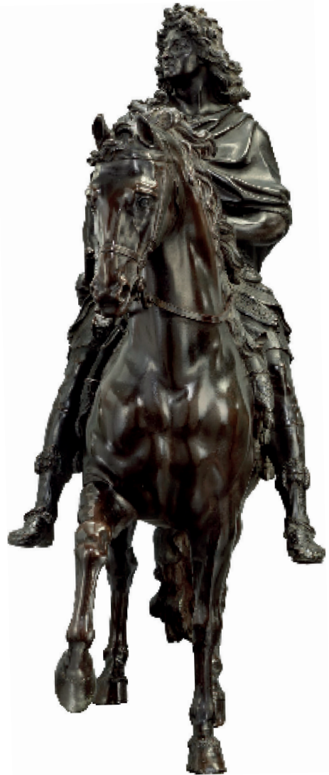
Antoine Coysevox (1640-1720) La statue équestre de Louis XIV - Bronze

L'art moderne bouscule, se libère de tous les codes classiques de la représentation du réel quand les œuvres contemporaines interrogent leur époque en cherchant la réaction, le questionnement.