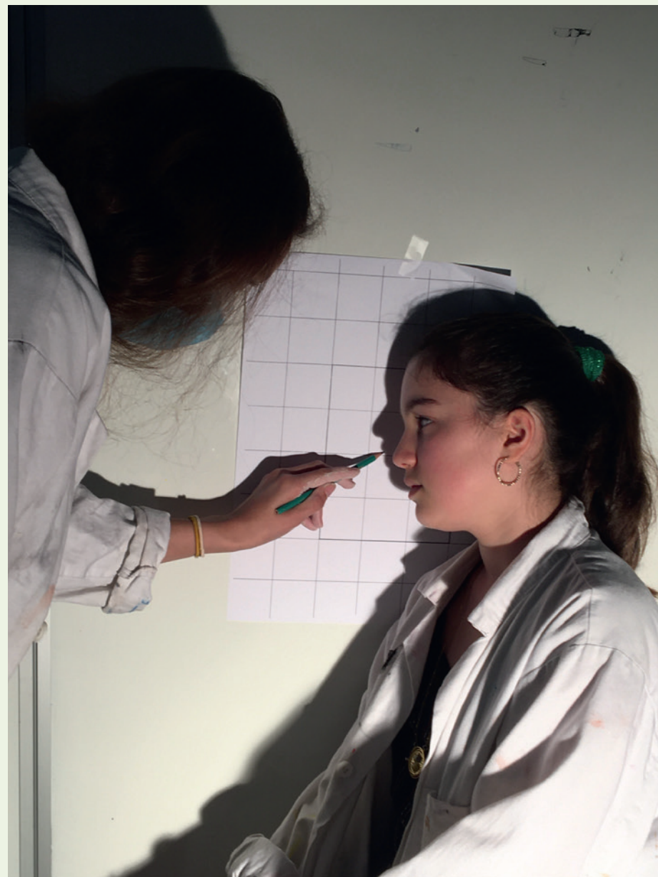
Atelier Croqu'musée Premier portrait