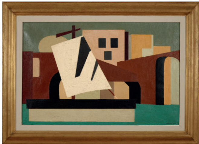
Le Pont, 1927

Accompagner les enfants dans la réponse : bleu-vert Marcelle Cahn a peint l'eau en bleu-vert.