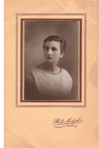
Marcelle Cahn, 1920

Quand elle est jeune, Marcelle Cahn peint des objets et des choses qu'elle a vues autour d'elle.