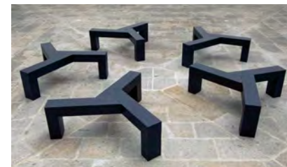
John Cornu, Sans titre (Fleury-Mérogis), 2012

mardi 16 janvier, 14h30 mardi 23 janvier, 14h30 mardi 6 février, 14h30 mardi 20 mars, 14h30