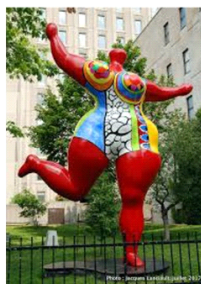
Nana Niki de Saint Phalle