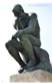
Le penseur Auguste RODIN

Cela se passait à Corinthe et ce fut grâce à sa fille, qui était amoureuse d'un jeune homme ; celui-ci partant pour l'étranger, elle entoura avec des lignes l'ombre de son visage projetée sur un mur par la lumière d'une lanterne ; sur ces lignes son père appliqua de l'argile et fit un relief ; et l'ayant fait sécher, il le mit à durcir au feu avec le reste de ses poteries.