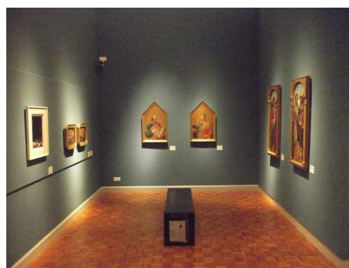
Salle des primitifs italiens

Peut-on imaginer une journée de grisaille à Rennes au XVIII ème siècle ?