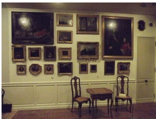
Chez Robien, Constellation des toiles : vues d'une partie de l'accrochage