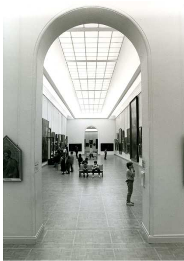
Galerie des collections XVIII e siècle en 1985