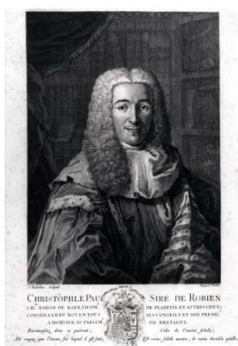
J-J Bachelou d'après Huguet Le président Robien dans son cabinet Vers 1740

L'une des particularités de cet ensemble de collections est d'avoir été réalisé par Christophe-Paul de Robien lui-même, mais aussi d'avoir été complété après sa mort par son fils Paul-Christophe Céleste de Robien (1731-1799).