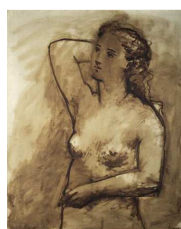
Pablo PICASSO (1881-1973) Nu à mi-corps 1923 Huile sur toile 100 x 80 cm