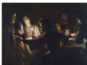
Gerrit VAN HONTHORST (1590-1656) Le Reniement de saint Pierre Huile sur toile 150 x 197 cm