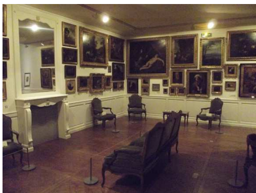
Chez Robien, Constellation des toiles : vue d'une partie de l'accrochage

Nous sommes donc dans un salon identique à celui des Robien. Le salon est un espace réservé à la famille et aux proches. Nous ne sommes pas dans un espace public.