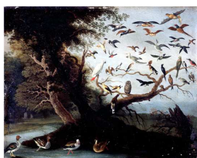
Jan KESSEL (1626-1679) L'Arbre aux oiseaux Huile sur cuivre 17 x 22 cm