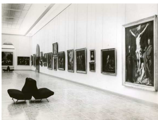
Le musée des beaux-arts de Rennes en 1960

La muséographie engage des démarches de conservation. Conserver, c'est à la fois protéger et montrer. On connaît la fragilité de certaines œuvres d'art, certains travaux ne supportent pas bien l'exposition prolongée à la lumière. La présence humaine est aussi souvent problématique : nous déplaçons involontairement de la poussière, nous émettons de la chaleur, notre respiration augmente de manière sensible le taux d'humidité des pièces que nous occupons. Et que dire du risque de dégradation volontaire ou même involontaire des œuvres ? Les dispositifs de conservation existent : mise sous vitre, vitrine, barrières... Ils peuvent être complexes, pour des raisons diverses, à mettre en place. Ils n'éliminent pas la totalité des risques. La muséographie évalue en permanence l'ensemble des problèmes que posent la fréquentation d'un public tout en se donnant pour mission l'accès de la culture au plus grand nombre.