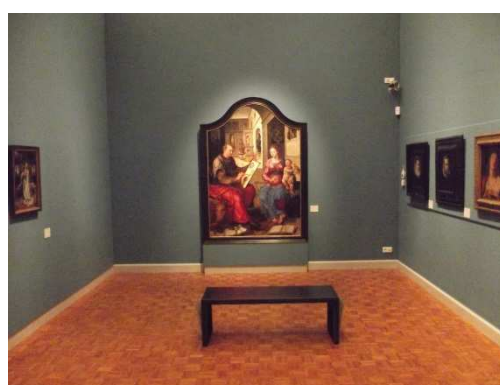
Le musée des beaux-arts de Rennes en 2015

Le choix de l'accrochage entraîne une réflexion globale et des approches multiples. La lumière, la couleur des murs, la disposition des peintures et les espacements entre chaque œuvre, l'approche thématique ou chronologique sont des questions incontournables. En prenant une option plutôt qu'une autre, le musée invite le public à adopter une posture réceptive spécifique face aux œuvres : par exemple, il est dans la contemplation ou plus dans une démarche interrogative, sa vision est centrée sur une peinture, une sculpture unique ou sa vision est plus globale.