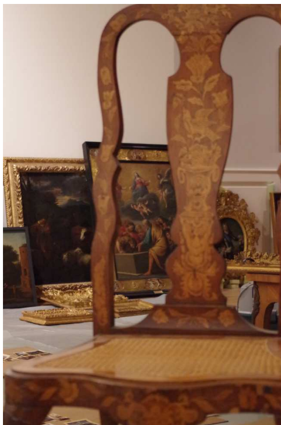
Montage de l'exposition