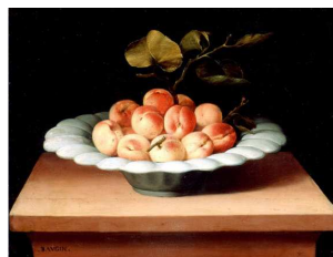
Lubin BAUGIN (1612-1663) Coupe de fruits Huile sur bois 37 x 49 cm