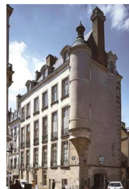
Hôtel de Robien 22, rue du Champ-Jacquet, Rennes

On connaît donc l'importance des collections dans l'univers personnel du président Robien puis de son fils. On perçoit rapidement le lien intime qu'il entretient avec ces objets archéologiques ou d'histoire naturelle. Mais que dire des peintures de cette collection ?