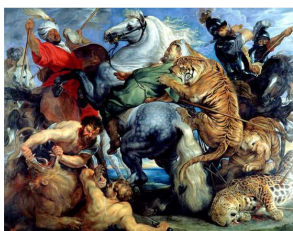
Pierre Paul RUBENS (1577-1677) La Chasse au tigre vers 1616 Huile sur toile 256 x 324 cm