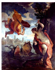
Paolo CALIARI dit VÉRONÈSE (1528-1588) Persée délivrant Andromède Huile sur toile 260 x 211 cm