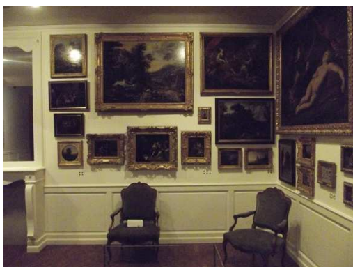
Chez Robien, Constellation des toiles : vue d'une partie de l'accrochage