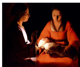
Georges de LA TOUR (1593-1652) Le Nouveau-né Huile sur toile 76 x 91 cm