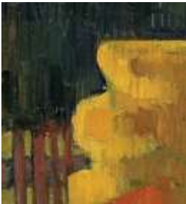
L'arbre Jaune, Émile Bernard

Émile Bernard a mis ses recherches plastiques au service de sa pensée artistique. Il joue avec la forme des objets, qu'il cerne d'un contour noir, et avec le format du support (la toile). Voici un détail de l'une de ses œuvres que tu trouveras au 1 er étage.