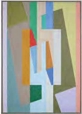
Sans titre (structure déployée) 1957 Huile sur toile 130 x 89 cm