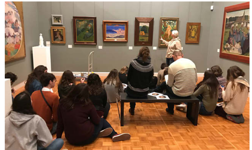
Visite commentée Travelling junior