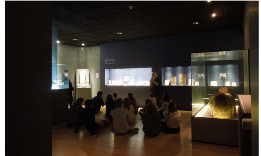
Visite commentée Archéologie

Une stèle funéraire pré-saïte sert de support à l'initiation à la lecture des hiéroglyphes et à la compréhension des méthodes de calcul. Le mystère de l'écriture sacrée est levé !