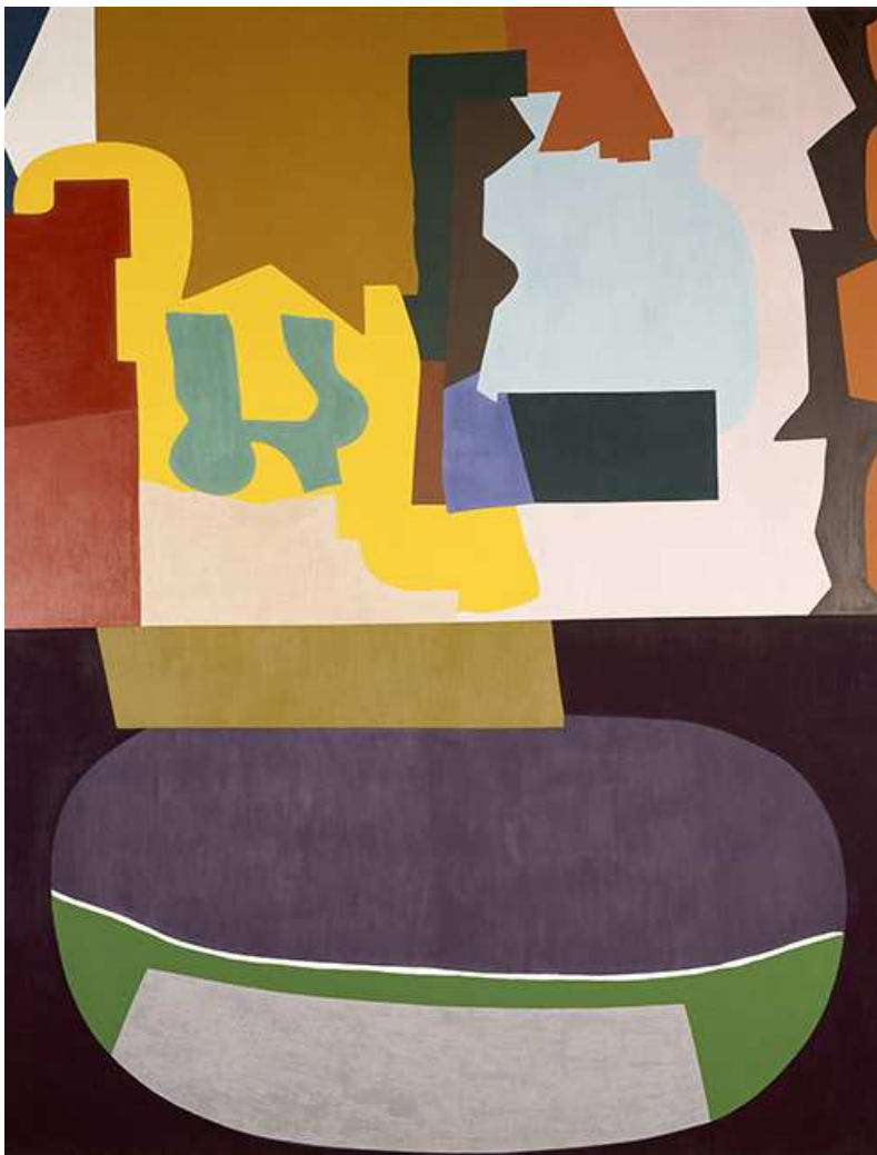
Shirley Jaffe (1923-2016) Voyage aux Indes (détail) 1976-1978

Le langage des couleurs n'est pas universel et change selon la localisation ou les époques. Des caractéristiques voire des propriétés ont été attribuées à chaque couleur. Le peintre utilise des pigments lui permettant d'obtenir de grandes variétés de couleurs. Il peut ainsi décrire fidèlement le monde qui l'entoure, traduire ses sensations de la lumière, ou exprimer des émotions.