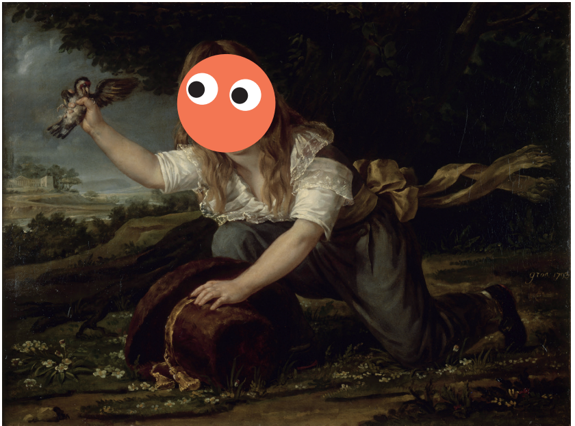
Antoine-Jean Gros, Portrait de Paulin des Hours (1793)

Visiter le musée avec ses élèves se fait de deux façons : soit avec un médiateur du musée soit en visite autonome sous la conduite d'un enseignant. Les réservations sont obligatoires pour les deux formes de visites.