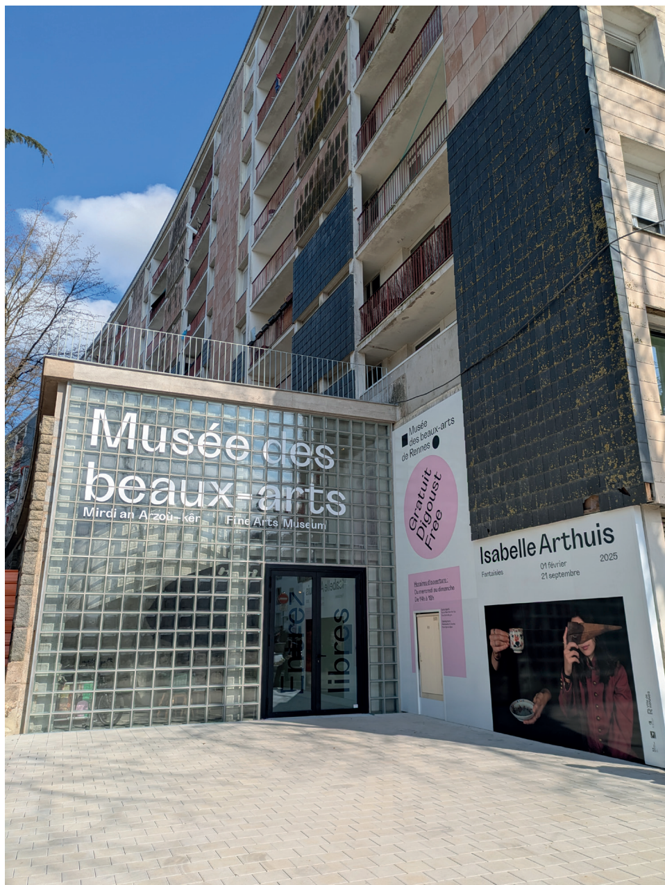
Vue de la façade du Musée des beaux-arts – Maurepas