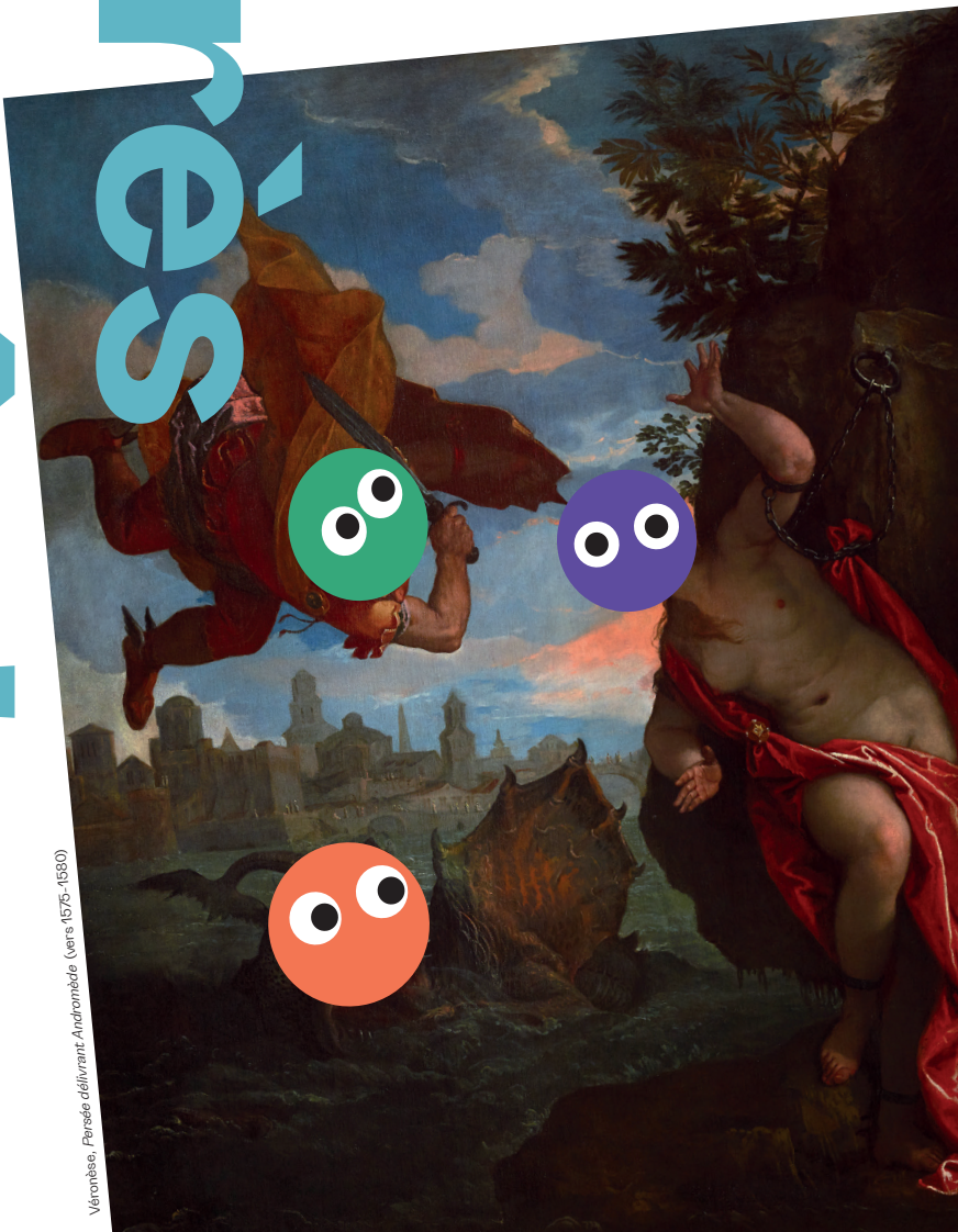
Véronèse, Pensée d'élivrant Andromède (vers 1576-1680)