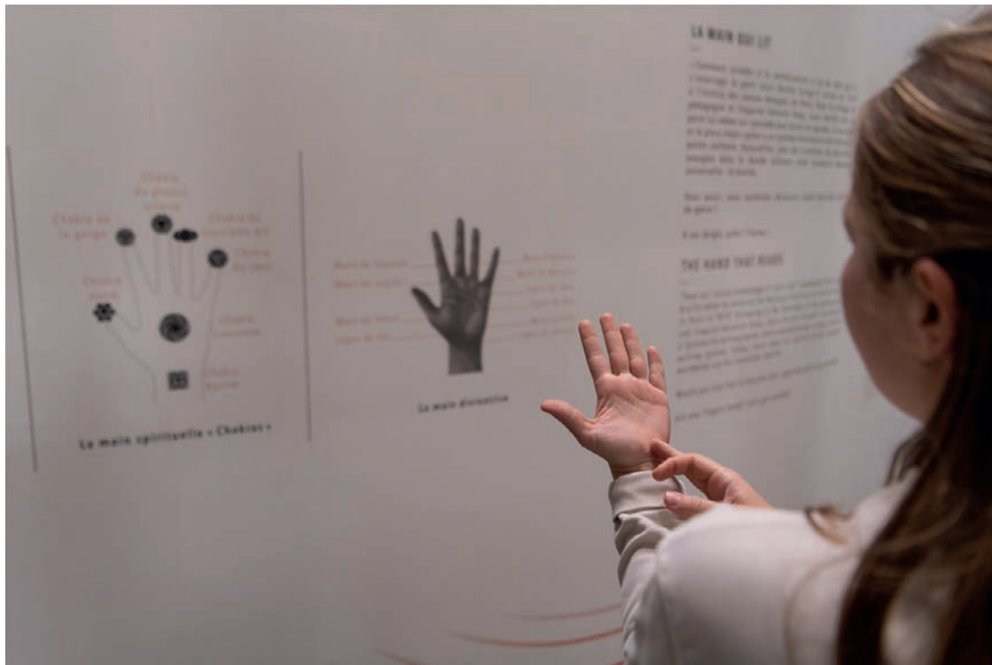
Palais des Beaux-Arts de Lille, crédit © Davy Rigault-CHU Lille.

Enfin, une bibliothèque d'albums jeunesse en lien avec les thématiques de l'exposition (la sculpture, les sens, la cécité, etc.) et un module avec un relief à toucher viennent compléter cet ensemble.