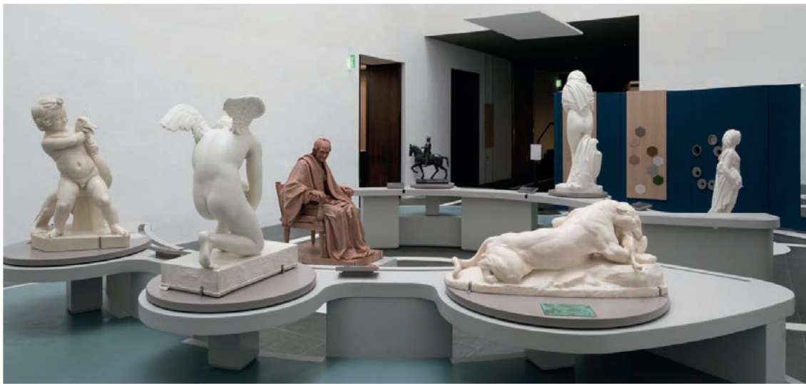
Musée Fabre – Montpellier Méditerranée Métropole