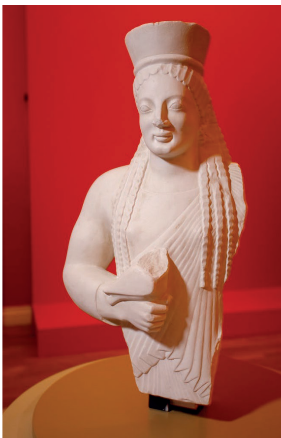
Prière de toucher ! Musée des Beaux-Arts de Rouen, 2022