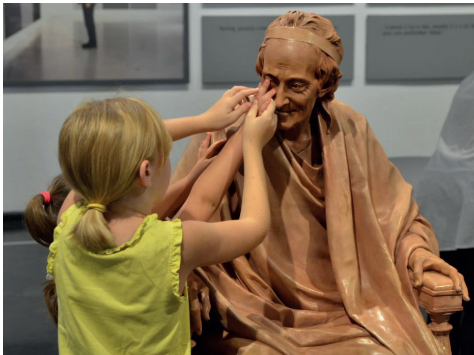
Musée des Beaux-Arts de Lyon

Le Musée des beaux-arts de Rennes présente sa nouvelle exposition 2024-2025 Prière de toucher ! L'Art et la Matière