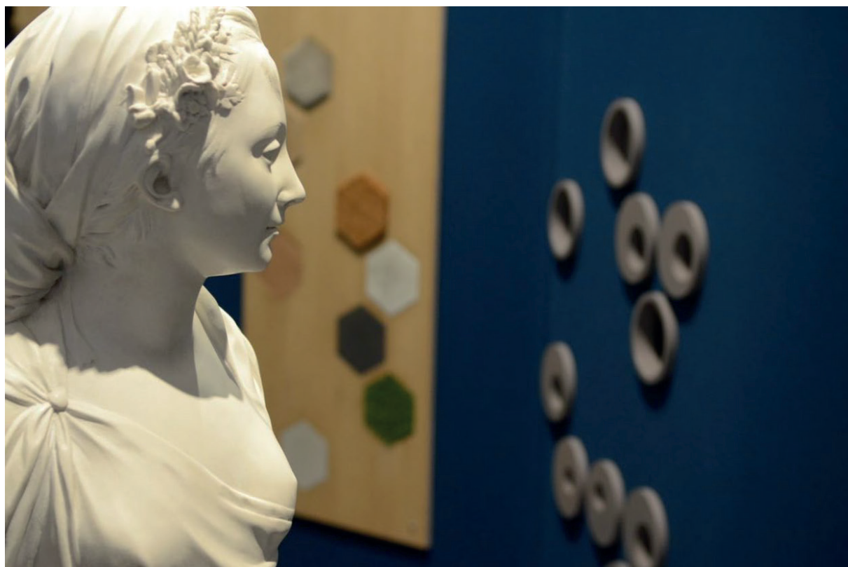
Musée des Beaux-Arts de Lyon