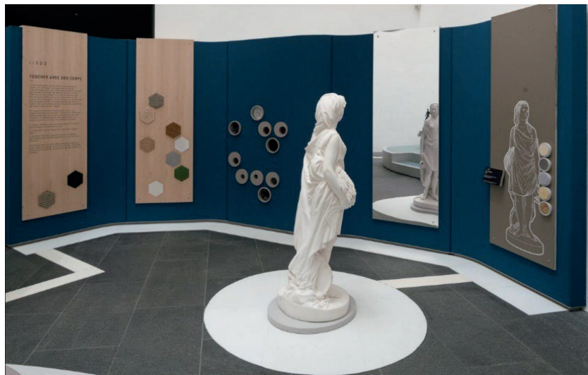
Musée Fabre – Montpellier Méditerranée Métropole

Module « Voir avec son corps » : cet espace ludique est destiné aux plus jeunes. Il est conçu pour préparer leur sens tactile et leur permet de découvrir de nombreux matériaux, de se familiariser avec les différentes sensations qu'ils procurent au toucher.