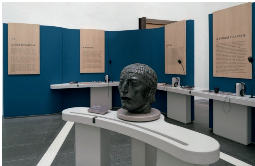
Musée Fabre – Montpellier Méditerranée Métropole © Photo : Musée Fabre.

Module L'atelier du sculpteur : il évoque les outils, le bruit, les différentes matières et étapes de la réalisation d'une sculpture, dans une approche multisensorielle qui plonge le visiteur dans l'ambiance d'un atelier de sculpteur.