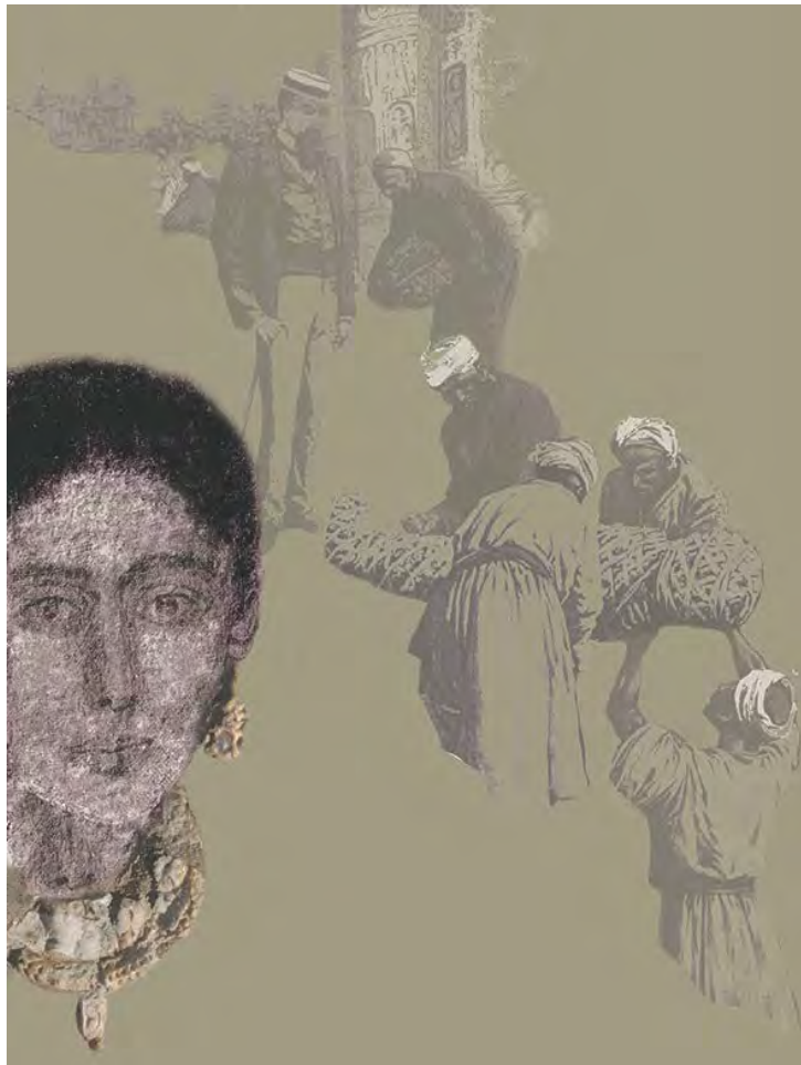
La Dame d'Antinoé III e à IV e siècle, Dépôt du Musée du Louvre en 1923

Le linceul peint de cette momie de femme d'époque romaine est le plus ancien portrait du musée.