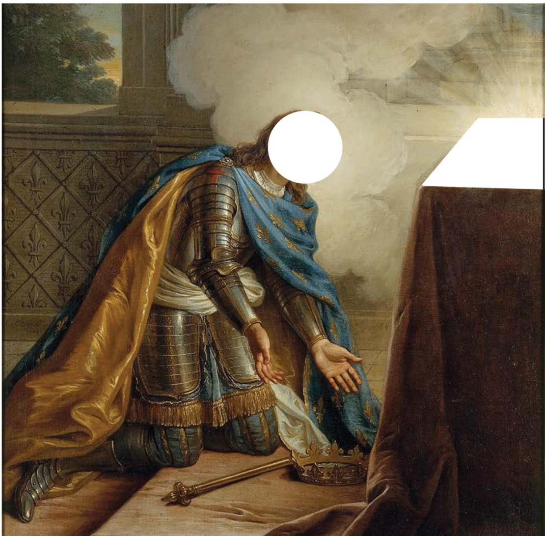
Saint Louis sous les traits de Louis XV à genoux devant la couronne d'épines, Charles-Antoine Coyvel

Dessine ton autoportrait sous les traits de Saint Louis et dessine ce qui pourrait expliquer cette attitude.