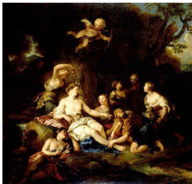
Le Repos de Diane, Charles de La Fosse, vers 1688.

Le Musée des Beaux-Arts de Rennes et le Musée d'Arts de Nantes présente une exposition en coproduction intitulée Éloge du sentiment et de la sensibilité – Peintures françaises du XVIIIe siècle des collections de Bretagne.